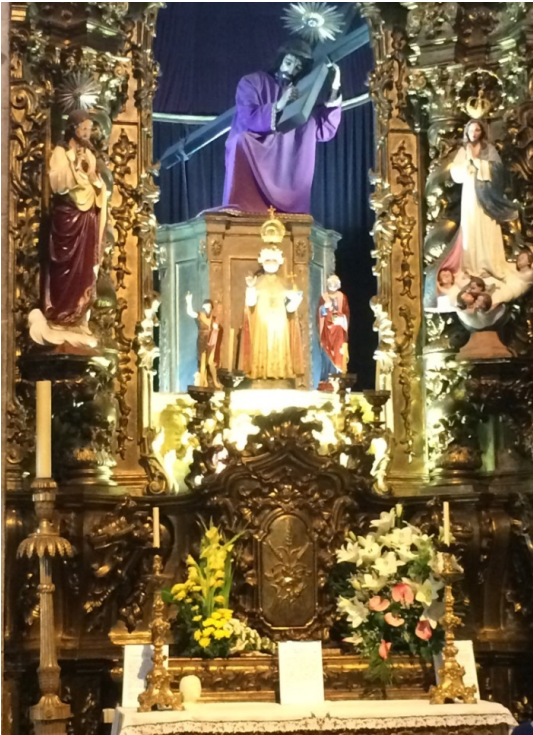
Afbeelding 13 Igreja dos Carmelitas (zij-altaar)

Toch richtte ook deze cultuur zich op het bevorderen van deugden die men in Noordwest Europa zo graag aan het Protestantisme toeschrijft. De bloei van een morele verbeelding, de individuele gewetensvorming, de cultuur van het medelijden en de bereidheid om iets aan de noden van arme medemensen te doen – aan dat alles werd ook in analfabete landen als Portugal en Spanje gewerkt. Het illustreert dat de impact van ruimtelijke verschillen soms wordt overschat. Volgens mij vallen die verschillen tussen Noord en Zuid Europa wel mee als men naar de normatieve strekking van het vroegmoderne beschavingsoffensief kijkt. Wellicht zijn temporele verschillen veel belangrijker dan de ruimtelijke. In elk geval is het opvallend dat er maar een klein tijdsverschil is tussen het moment waarop Johan Sebastiaan Bach in Duitsland zijn Matthäuspassion componeerde (1727), het moment waarop men in Porto de Igreja dos Carmelitas begon te bouwen (1756) en het moment dat Adam Smith in Schotland zijn Theory of Moral Sentiments schreef (1759). Zelf ben ik geneigd om deze werken te zien als het product van een nieuwe gevoeligheid die in de achttiende eeuw begint te ontstaan. Hoewel die gevoeligheid in meerdere vormen tot uitdrukking komt (muziek, beelden en tekst) gaat het om eenzelfde geest. Mijn conclusie zou zijn dat Noordelingen niet te snel moeten denken dat het geloof uitsluitend via de taal werkzaam is.