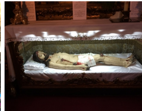
Afbeelding 6 Igreja dos Carmelitas (detail zij-altaar)

Nu staat deze visuele verbeelding van het Museu da Misericórdia niet op zichzelf. Dat blijkt als men een aantal kerken uit het vroegmoderne Porto bezoekt. Ik vermeld hier een bezoek dat we aan de befaamde Igreja dos Carmelitas hebben gebracht, een gebouw dat alle kenmerken vertoont van de zogeheten Barok. Het meest opvallende daarin zijn de verschillende zijaltaren die niet alleen beelden van Christus, Maria of specifieke heiligen bevatten maar ook tal van ornamenten, bijfiguren, symbolische verwijzingen, bloemen, gebeden, attributen, kaarsen et cetera. ( afbeelding 4, 5 en 6 ). Er is veelvuldig gebruikt gemaakt van bladgoud en kleur waardoor het geheel enige gelijkenis toont met de heiligdommen die men in Azië vindt. Ook op deze taferelen is het lijden van Christus en het medelijden van Maria veelvuldig te zien. Er is veel aandacht besteed aan de visuele uitbeelding van alles wat morele gevoelens oproept. Christus hangt niet alleen aan het kruis, er stroomt ook