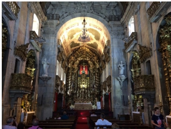
Afbeelding 4 Igreja dos Carmelitas (hoofdaltaar)

gebruikt. Daaronder natuurlijk portretten van de rijke stedelingen die de organisatie hebben gesteund en van bestuurders die haar hebben geleid. De collectie bevat echter ook opvallend veel beelden die betrekking hebben op het lijden van Christus en op het medelijden dat zo werd gemobiliseerd. Deze beelden zullen meerdere functies hebben gehad maar een belangrijke was dat gewone gelovigen zo konden leren hoe medelijden in zijn werk gaat. Schilderijen en andere afbeeldingen lieten letterlijk zien wat marteling, pijn of sterven met een mens doet en welke lichamelijke reacties dat oproept bij degenen die er getuige van zijn. Het oerbeeld in deze is uiteraard de piëta, waarbij een gestorven Christus in de armen van de Moeders Gods ligt ( afbeelding 1 ). Andere beelden doen voor hoe men zich tot de hemel kan wenden voor een verzoek of hoe men kan bidden om troost ( afbeelding 2 en 3 ). Dat soort beelden laten de gelovigen zien wat verdriet en troost of lijden en barmhartigheid is. Ze bieden een vorm van aanschouwelijk onderwijs dat zijn effect niet zal hebben gemist in een tijd dat het merendeel van de gelovigen nog analfabeet was. Juist door de morele verbeelding op een zichtbare wijze te mobiliseren kon de overgang van woorden naar daden of van geloof naar praktisch handelen worden gemaakt.