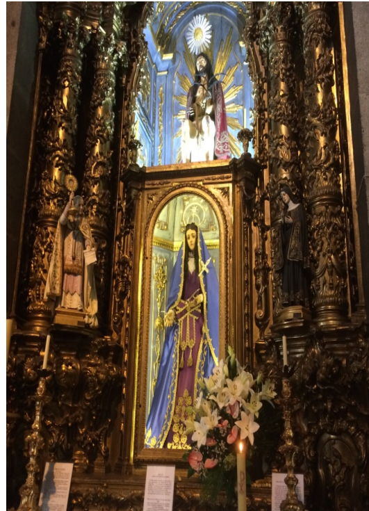
Afbeelding 14 Igreja dos Carmelitas (zij-altaar)