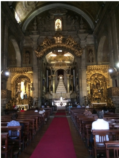
Afbeelding 7 Igreja de Santo Antonio: hoofdaltaar en zij-altaar

heel wat bloed uit zijn lijf, de knieën zijn geschonden, de doornenkroon dringt zich diep in het vlet cetera. De smarten die Maria moet lijden bij het zien van haar zoon blijken niet alleen uit haar bedroefde gelaat maar worden mede gesymboliseerd doordat haar hart met een zwaard is doorboord. In bepaalde gevallen – zoals bij een altaar dat naast het hoofdaltaar in de Igreja de Santo Antonio staat – zijn er zelfs zeven messen in haar lichaam gezet ( afbeelding 7, 8 en 9 ). Uiteraard beperkt deze verbeelding zich niet tot de hoofdfiguren van het lijdensverhaal. Er zijn eveneens altaren waar we de marteldood van bepaalde heiligen zien terwijl er evengoed plaatsen in de kerk zijn waar de glorieuze overwinning op de dood en het lijden uitgebeeld wordt. De gelovige die in deze kerken naar de mis gaat, is als het ware van alle kanten omgeven door beelden die hem wijzen op de implicaties van het geloof. Doordat zowel het lijden van Christus als het verdriet van de omstanders op een levendige wijze voorgesteld wordt, kan de gelovige zich deze beelden eigen maken waardoor een vorm van morele gevoeligheid tot ontwikkeling komt die tot dat moment alleen voor een elite van geestelijken of kloosterlingen weggelegd was.