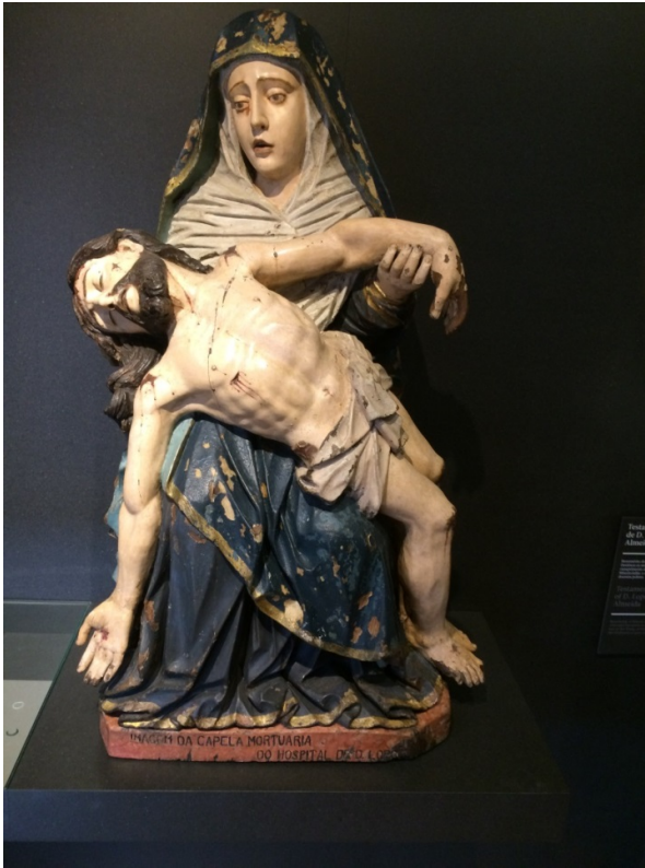
Afbeelding 1 Museu da Misericórdia do Porto

samenstelling van het bestuur hield men vaste verhoudingen aan zodat het beoefenen van barmhartigheid niet alleen een zaak van de adel maar ook van de stedelijke burgerij werd. Zij konden zich op deze wijze bekwamen in de bijzondere morele dialectiek die het christendom altijd heeft gekend en die een omkering van de bestaande verhoudingen vraagt. Zo werd aan de rijken geleerd dat hun geestelijk heil afhankelijk was van de bereidheid om zich voor de armen in te zetten. Blijkens de vele giften die het werk van de Misericórdia do Porto mogelijk maakten zoals legaten en testamenten zijn velen dit tot ver in de negentiende eeuw blijven doen. Maar ook dit deed zich in andere regionen van het Europese continent voor.