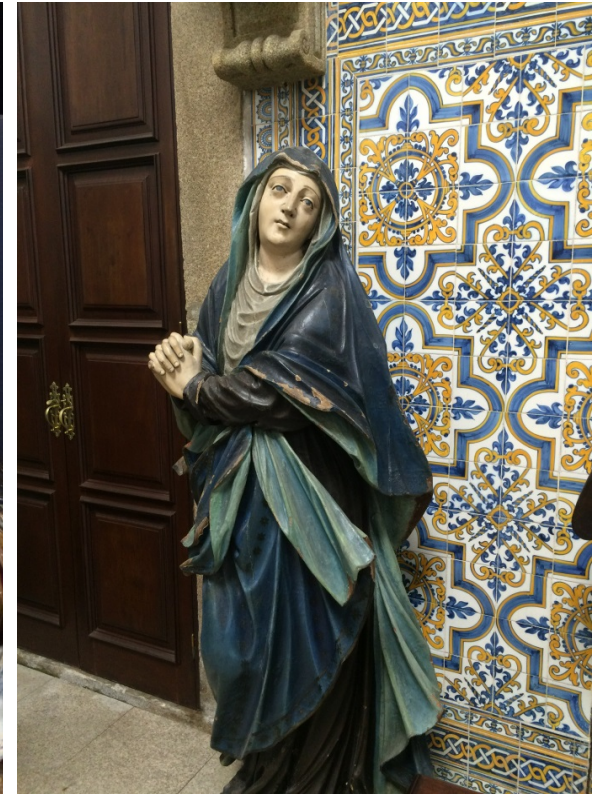
Afbeelding 3 Museu da Misericórdia do Porto

Wat mij in de geschiedenis van deze Portugese instelling vooral boeide was de rol van morele verbeelding in dat verband. Het museum legde in de loop der eeuwen een grote verzameling schilderijen, portretten, banieren en standbeelden aan die bij uiteenlopende gelegenheden werden