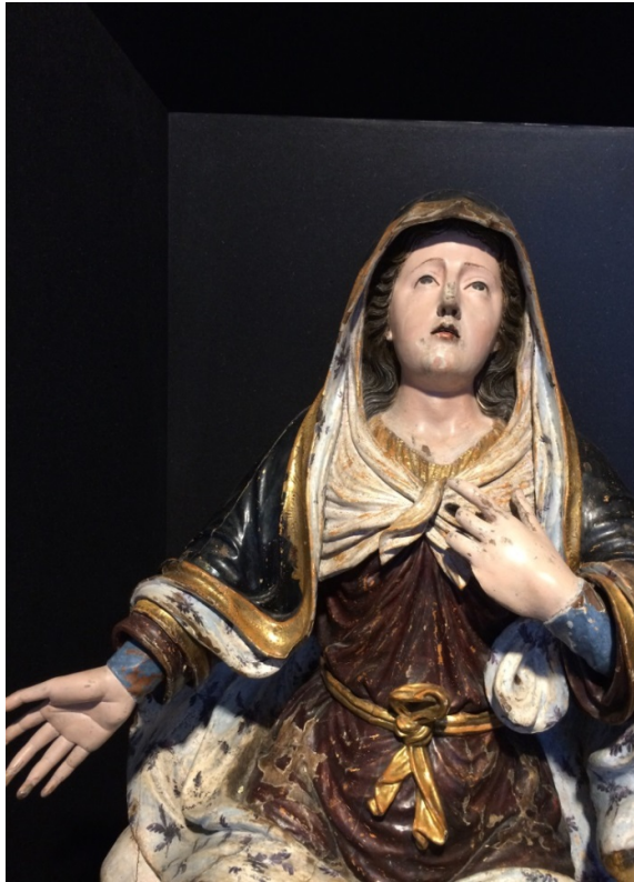
Afbeelding 2 Museu da Misericórdia do Porto