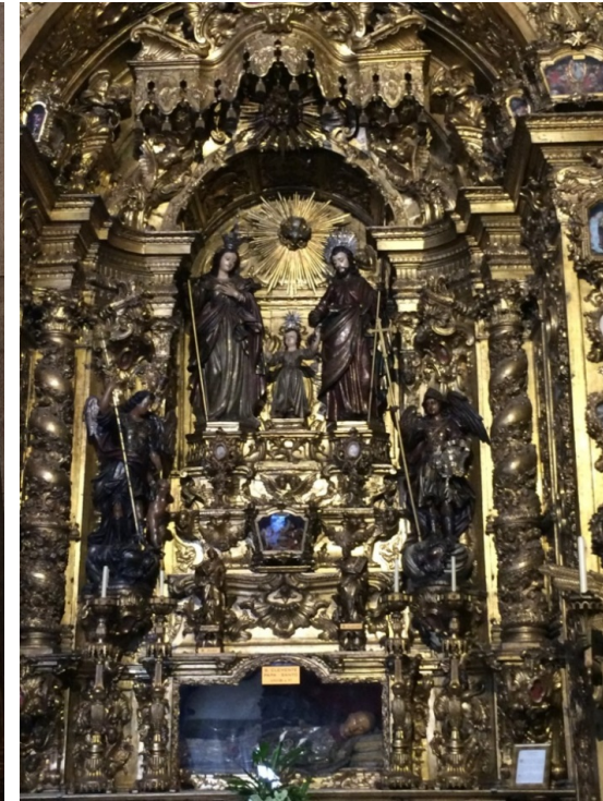
Afbeelding 15 Igreja de Santo Antonio (zij-altaar)