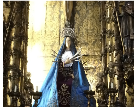
Afbeelding 9a en 9b Igreja de Santo Antonio (details zij-altaar)