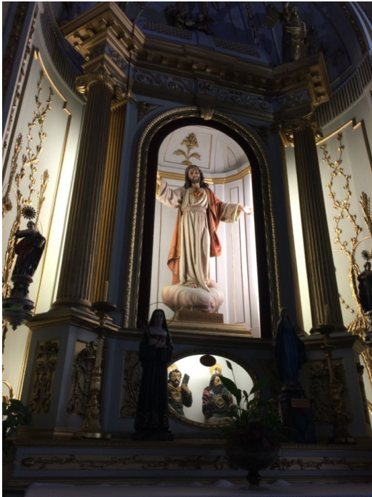
Afbeelding 10 Igreja de Santo Antonio (zij-altaar)

op een plastische wijze gebruikt. Het gaat om gezichtsuitdrukkingen, gebaren en houdingen die men als gelovige kan nadoen ook als men de theologische achtergronden ervan niet volledig doorgrondt. Ten tweede valt op dat de katholieke kerk een zeker polytheïsme handhaaft. Men gelooft uiteraard aan het bestaan van een God maar intussen blijkt het goddelijke in meerdere gedaanten aanwezig te zijn: Vader, Zoon en Heilige Geest. Verder is er de Maagd Maria die een semi-goddelijke status geniet en waarvan de verering in Portugal tot op de dag van vandaag zeer populair is. Ten slotte is er een hele reeks Heiligen die elk op een eigen manier bemiddelen tussen sacrale en de profane sfeer ( afbeelding 10, 11 en 12 ). Dat alles staat haaks op het protestantse geloof dat elke bemiddeling van de hand wees en elke tussenpersoon (heilige, priester) als een verleiding tot bijgeloof zag. Ten derde ontwikkelde het katholicisme een andere vormentaal die niet zonder reden Barok wordt genoemd. Ze toont een overdaad aan figuren, ornamenten, kleuren, beeltenissen, heilige voorwerpen en rituele praktijken die met de sobere leegte van het protestantse interieur contrasteert ( afbeelding 13, 14 en 15 ). Zo vertegenwoordigt deze Zuid Europese cultuur van de achttiende eeuw een veelzeggend contrapunt van het Protestantisme dat in Noord Europa tot ontwikkeling kwam: beeld versus tekst, polytheïsme versus monotheïsme, overdaad versus zuinigheid, zichtbaarheid versus innerlijkheid.