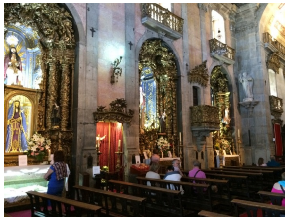
Afbeelding 5 Igreja dos Carmelitas (zij-altaren)