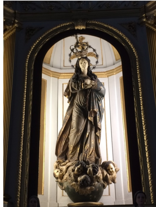
Afbeelding 11 Igreja de Santo Antonio (zij-altaar)